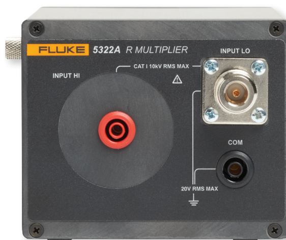
Chaque 5322A est accompagné d'un multiplicateur de résistance externe, pour alimenter les résistances jusqu'à 10 TΩ, afin de tester les contrôleurs d'isolement.