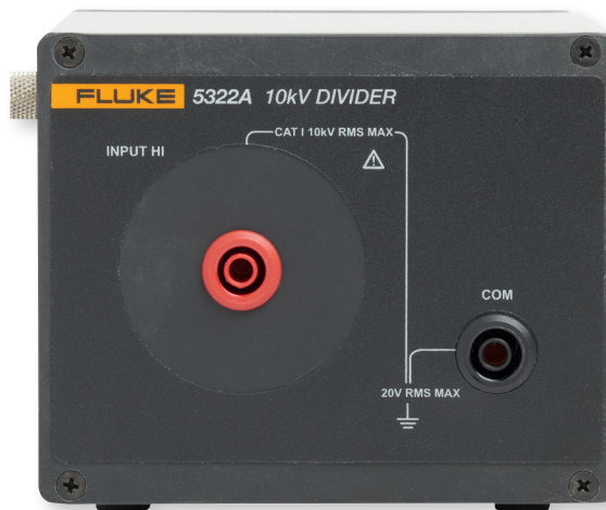
Le 5322A comprend un diviseur externe de 10 kV pour mesurer les testeurs avec sorties de 10 kV.

Ce large éventail d'options de modèles vous permet de sélectionner le modèle adapté à votre charge de travail et votre budget.