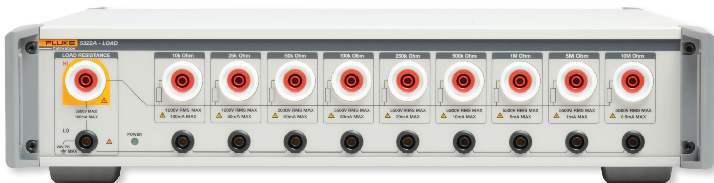
Option de charge haute résistance 5322A-LOAD facultative